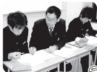
▲マイ・ベストコース授業風景